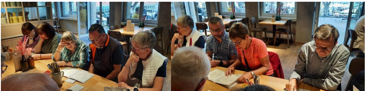
Dur ! dur ! de choisir son menu