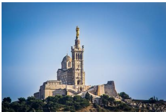
Basilique de Notre Dame de la Garde

Tel : 06 48 93 25 82 Courriel : patrickrothera@gmail.com