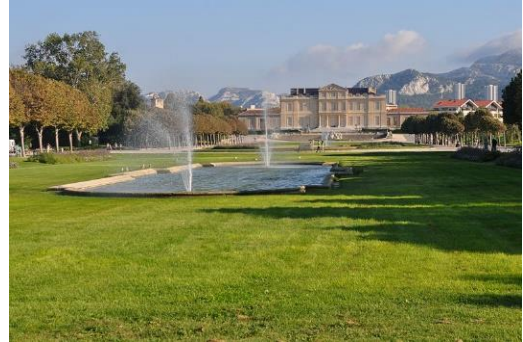
Le Parc Borély / Tourisme - Marseille.com

Balade via le bord du ruisseau Huveaune, le parc Borély, la plage du Prado, Notre Dame de la Garde et retour à l'hôtel.