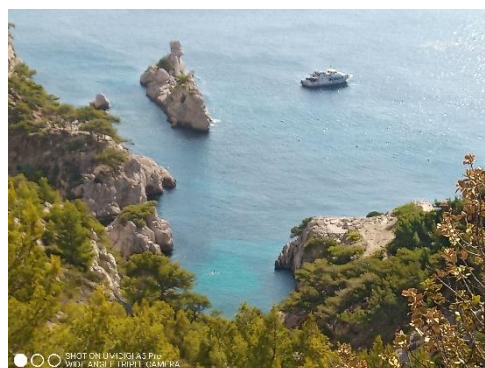
Vallon de Sormiou et Torpilleur

Laissez-vous imprégnés par la splendeur des lieux.