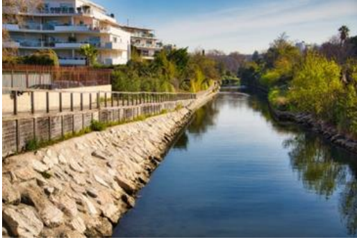
Le Ruisseau Huveaune

Balade via le bord du ruisseau Huveaune, le parc Borély, la plage du Prado, Notre Dame de la Garde et retour à l'hôtel.