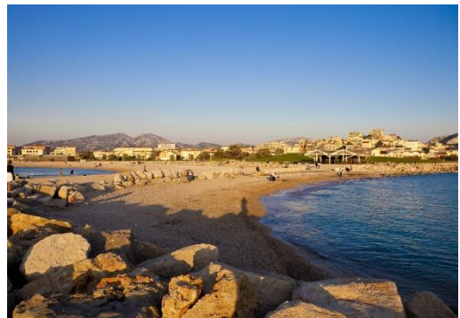
La plage du Prado