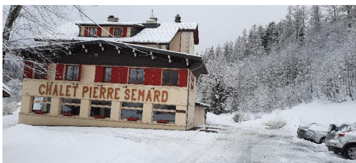
Le chalet Principal

Le chalet Pierre SEMARD : Situé dans la vallée de Chamonix, à la lisière du hameau des Frasserands, à proximité de la gare de Montroc-le-Planet à 2 km du village d'Argentière, face à l'aiguille du Midi et au MontBlanc, ce chalet a une histoire qui est imbriquée dans l'histoire même de la Fédération CGT des Cheminots. À l'origine, l'initiative de son acquisition en revient à l'Union des syndicats du Sud-Est qui décide, après que le Front populaire eut permis de conquérir les congés payés, de mettre à la disposition de ses syndiqués un lieu de séjour de vacances. L'acte d'acquisition du chalet a été signé le 13 avril 1938, son inauguration à Noël de la même année en présence de Pierre SEMARD, secrétaire général de la Fédération. Les premiers vacanciers n'y arrivèrent que pour la saison d'été 1939. Triste année qui vit, entre autres, l'arrestation et l'emprisonnement de Pierre SEMARD. Il n'en ressortira que pour être fusillé le 7 mars 1942 par le régime de Vichy et les nazis. Désormais le nom du chalet est indéfectiblement attaché à Pierre SEMARD. Implanté sur une propriété de 4 hectares avoisinant des chalets typiques anciens et plus récents semblant s'être accordés pour conserver au village un caractère singulier. C'est un village vacances 2 étoiles, œuvre commune de la Fédération CGT des Cheminots et de l'Orphelinat National des Chemins de Fer de France (ONCF). Il a été entièrement rénové en 1998 et amélioré pendant sa fermeture pour cause de crise sanitaire en 2021