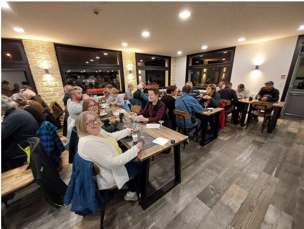
La salle de restauration